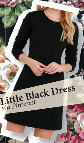
Little Black Dress