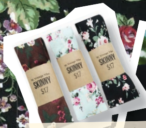
W Vintage Vibe