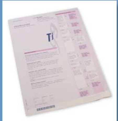
Een Tj biljet

Het tweede deel bestaat uit de premies volksverzekeringen. Dit is geld dat gebruikt wordt om (bijvoorbeeld) de AOW